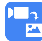
Video zu Bildconverter